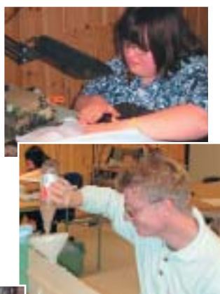
Produksjonen av Dorcas Micro Pack foregår i sin helhet på Jevnaker arbeidssenter.