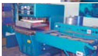
Produksjonen av Dorcas Activator Pack, Dorcas Gel Pack og Dorcas Cold Pack flyttes nå til Norge.